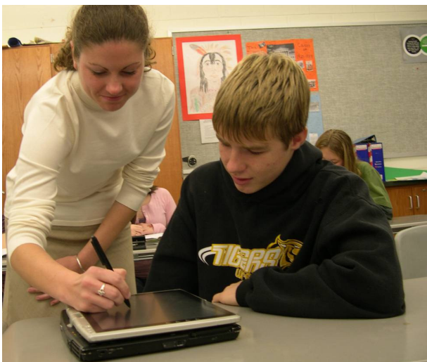
Profesora explicando a sus alumnos los contenidos del blog de la materia que imparte