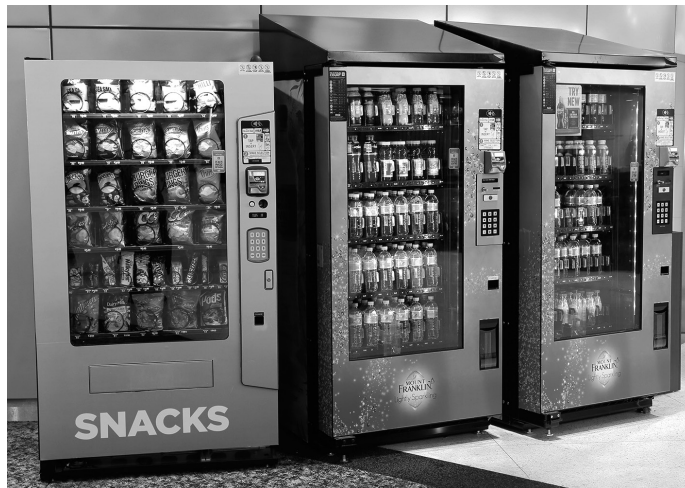
Ejemplo de máquina expendedora