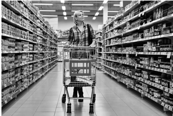
El establecimiento de libre servicio permite circular al cliente a lo largo de la sala de ventas.

Son establecimientos comerciales de cierto tamaño, que permiten al cliente circular con libertad por la sala de ventas , de forma que pueden ver, tocar y comparar los productos antes de adquirirlos.