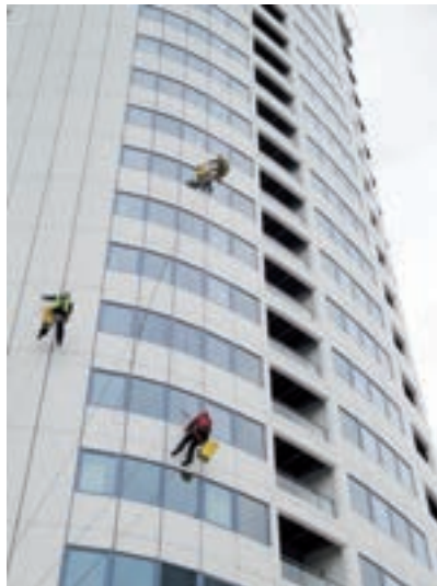
Trabajadores de limpieza de cristales expuestos al riesgo de caída en altura.

Las actividades realizadas habitualmente por los trabajadores de la limpieza pueden ser muchas y muy variadas, pero por ejemplo se pueden encontrar: fregar con agua o limpiar en seco tanto superficies como toda clase de suelos, ya sea de forma manual o con el uso de diferentes maquinarias de limpieza, limpieza de mobiliario, abrillantar o encerar suelos, limpieza de textiles, limpieza de cocinas y desinfección de servicios sanitarios, etc.