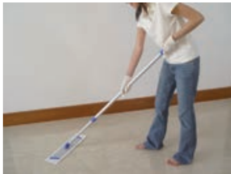
Esta actividad implica un riesgo de trastorno musculoesquelético.

los por completo. En cambio, si no se identifican los riesgos no se puede saber cómo eliminarlos o reducirlos en su origen.