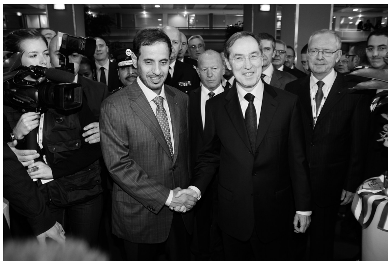
Una coalición es la entidad creada a partir de la unión de dos o más partidos políticos.

Las mismas penas se impondrán, en sus respectivos casos, a quien entregue donaciones o aportaciones destinadas a un partido político, federación, coalición o agrupación de electores, por sí o por persona interpuesta, en alguno estos supuestos.