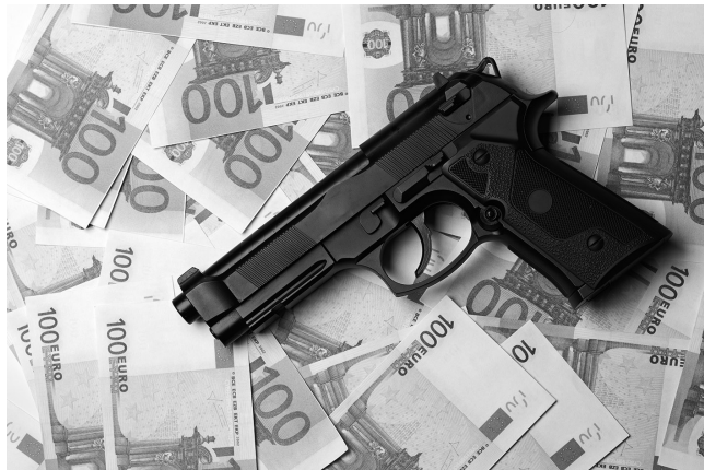
El delito de financiación del terrorismo se completa con lo establecido en la ley 12/2003, de 21 de mayo, de Bloqueo de la Financiación del Terrorismo.

Se consideran igualmente delitos de terrorismo los delitos informáticos, ya explicados, cuando los hechos se cometan con alguna de las finalidades mencionadas.