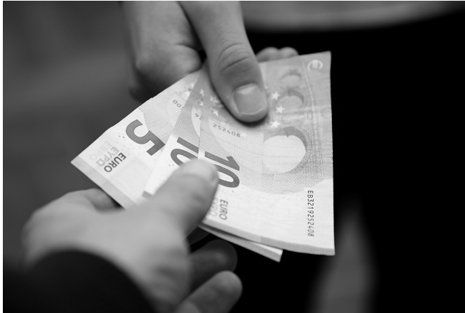
Se entiende por dádiva una cosa que se da como regalo.

El delito de cohecho está regulado en los artículos 419 a 427 del Código Penal.