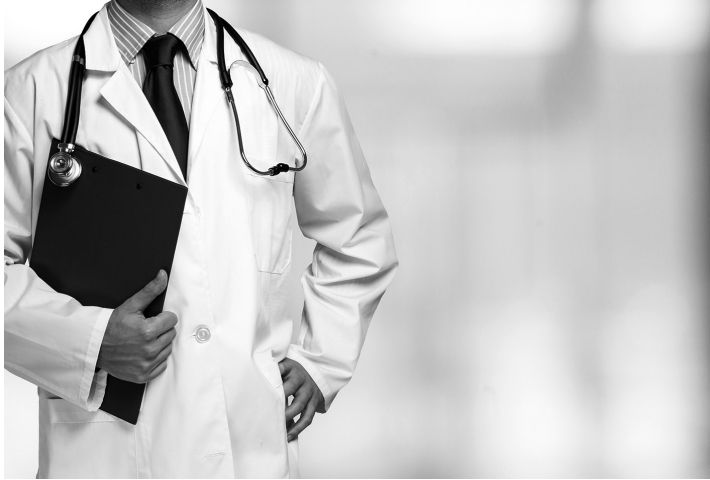
La salud pública se regula en la ley 33/2011, de 4 de octubre, general de Salud pública.

La persona que, con conocimiento de su falsificación o alteración, importe, exporte, anuncie o haga publicidad, ofrezca, exhiba, venda, facilite, expendo, despache, envase, suministre, incluyendo la intermediación, trafique, distribuya o ponga en el mercado cualquiera de los medicamentos, sustancias activas, excipientes, productos sanitarios, accesorios, elementos o materiales mencionados, y con ello genere un riesgo para la vida o la salud de las personas, será castigada con una pena de prisión de seis meses a cuatro años, multa de seis a dieciocho meses e inhabilitación especial para profesión u oficio de uno a tres años, al igual que quien los adquiera o tenga en depósito con la finalidad de destinarlos al consumo público, al uso por terceras personas o a cualquier otro uso que pueda afectar a la salud pública.