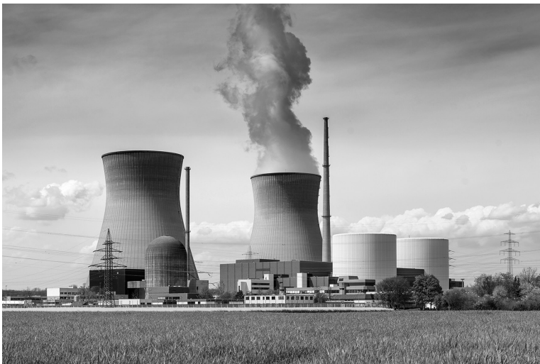
La perturbación de la actividad de una central nuclear da lugar a una conducta delictiva.

Respecto a los delitos relativos a la energía nuclear y a las radiaciones ionizantes, el Código Penal establece que la persona que libere energía nuclear o elementos radiactivos que pongan en peligro la vida o la salud de las personas o sus bienes, aunque no se produzca explosión, será sancionada con la pena de prisión de quince a veinte años, e inhabilitación especial para empleo o cargo público, profesión u oficio por tiempo de diez a veinte años. Asimismo, la persona que perturbe el funcionamiento de una instalación nuclear o radiactiva, o altere el desarrollo de actividades en las que intervengan materiales o equipos productores de radiaciones ionizantes, creando una situación de grave peligro para la vida o la salud de las personas, será sancionada con la pena de prisión de cuatro a diez años, e inhabilitación especial para empleo o cargo público, profesión u oficio por tiempo de seis a diez años.