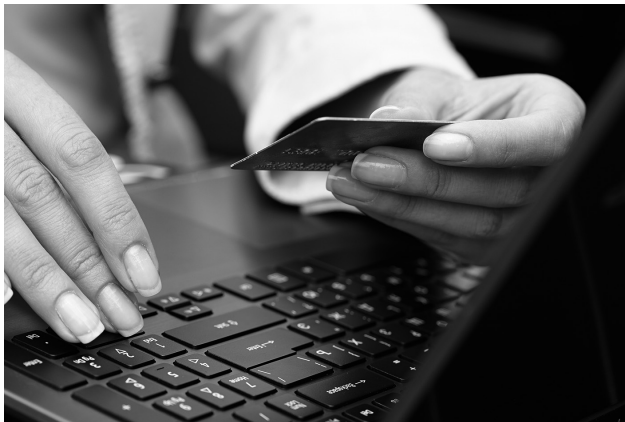
Una persona puede obstaculizar el correcto funcionamiento de un sistema informático. Esta conducta es delictiva.

Será castigado con una pena de prisión de seis meses a dos años o multa de tres a dieciocho meses el que, sin estar debidamente autorizado, produzca, adquiera para su uso, importe o, de cualquier modo, facilite a terceros, con la intención de facilitar la comisión de alguno de los delitos mencionados: