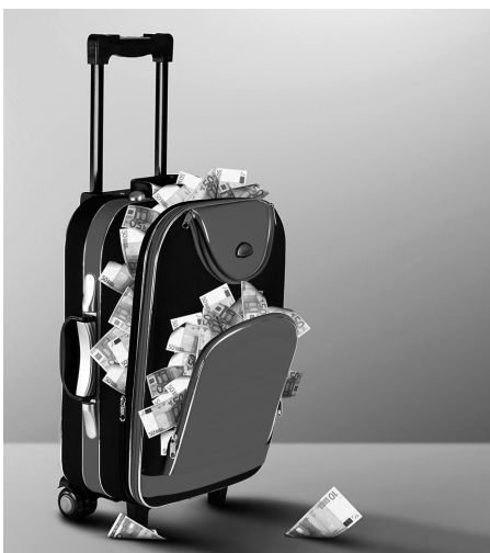
Una persona puede ocultar su patrimonio para declararse insolvente, incurriendo en un delito.

Este tipo de delito puede cometerse dentro de cualquier tipo de empresa, al igual que el delito de estafa, siendo por tanto de especial importancia en el programa de compliance .