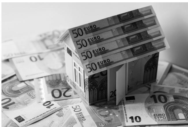
Una construcción ilegal supone un beneficio económico a la persona beneficiaria de la misma.

Atendidas las reglas establecidas en el artículo 66 bis, los jueces y tribunales podrán asimismo imponer las penas recogidas en las letras b) a g) del apartado 7 del artículo 33.