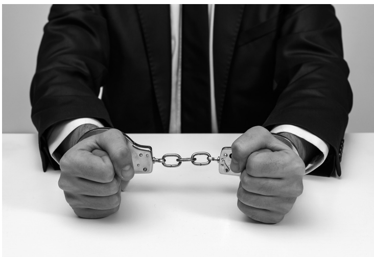
Falsificar un modelo de informe de la Seguridad Social es una conducta delictiva.

En estos casos, además de las penas descritas, se impone al responsable la pérdida de la posibilidad de obtener subvenciones o ayudas públicas y del derecho a gozar de los beneficios o incentivos fiscales o de la Seguridad Social durante el período de cuatro a ocho años.