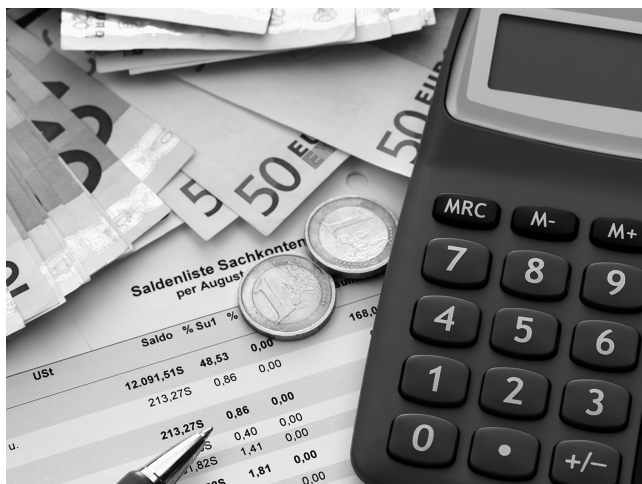
Los delitos contra la Hacienda pública conllevan una pena, además, de la pérdida de la posibilidad de obtener subvenciones.

Además de las penas señaladas, se imponen al responsable la pérdida de la posibilidad de obtener subvenciones o ayudas públicas y del derecho a gozar de los beneficios o incentivos fiscales o de la Seguridad Social durante el período de tres a seis años.