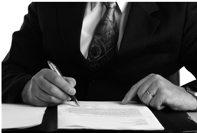
El delito relativo a la propiedad intelectual afecta al autor económicamente.