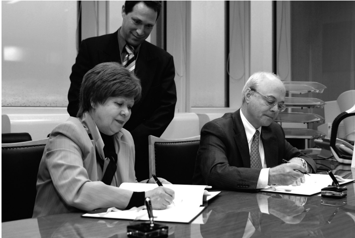
En la sociedad anónima existe la posibilidad de atraer capitales ajenos por medio de la emisión de obligaciones.

La ventaja más evidente es que los accionistas no responden de las deudas con su patrimonio personal sino solamente con el capital aportado.