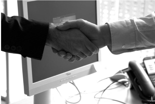
Las personas jurídicas de pequeñas dimensiones también tienen responsabilidad.

hubieran sustraído a la acción de la justicia, no excluye ni modifica la responsabilidad penal de las personas jurídicas.