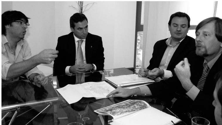
La empresa debe realizar modelos de organización, gestión y control para una correcta aplicación normativa. Para ello es necesaria la comunicación.

En los casos en los que estas circunstancias solamente puedan ser objeto de acreditación parcial, esta circunstancia es valorada a los efectos de atenuación de la pena.