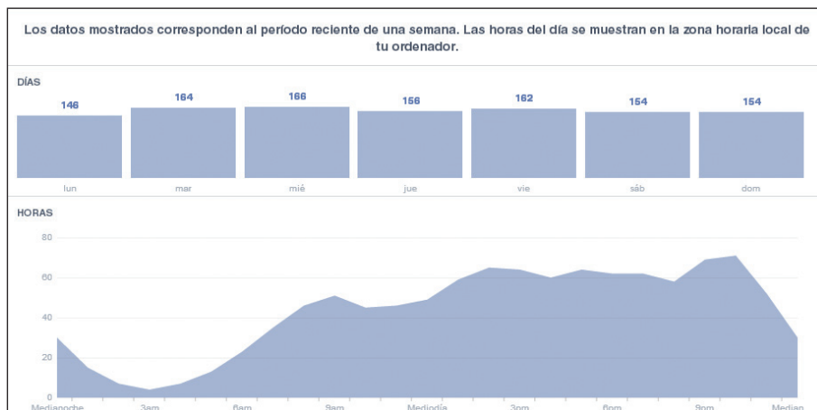
Estadísticas de Facebook para Publicaciones

En el mercado existen múltiples herramientas que pueden proporcionar estos datos, como Google Analytics , Facebook Insights o SocialBro . Lo importante es saber que esta información no es estática, puede cambiar de una semana a otra, o con mayor rapidez, por lo tanto, habrá que revisarla con frecuencia para que la estrategia funcione realmente.