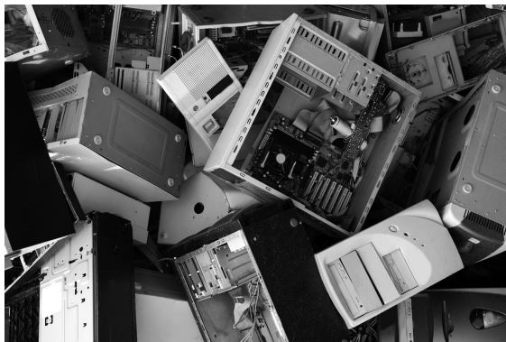
Ejemplo de residuos de aparatos eléctricos y electrónicos (RAEE)

Para paliar esta situación se aprobó una nueva legislación que obliga a los productores a establecer y gestionar los canales de recogida y reciclaje de estos residuos, y a los consumidores, a entregar los aparatos eléctricos y electrónicos que ya no desee en los puntos de recogidas establecidos.