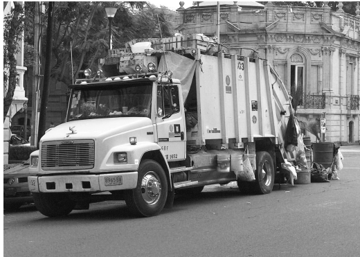
Transporte de los residuos hasta la empresa recicladora