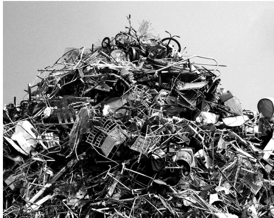
Ejemplo de residuos de televisores y monitores con TRC.