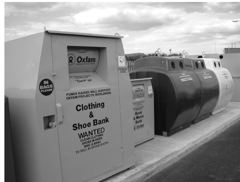
Ejemplo de Punto Limpio