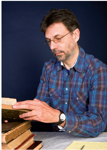
El profesorado debe ser facilitador de aprendizaje.