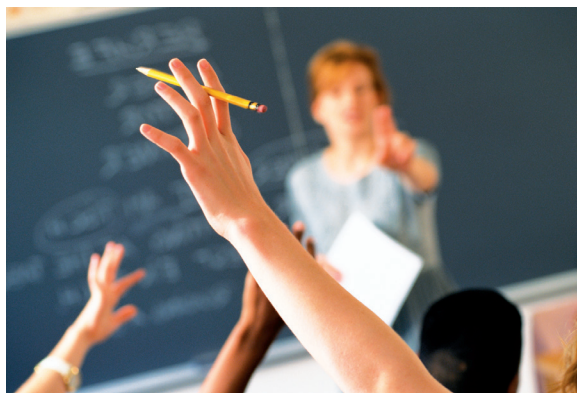
El profesor/a deber ser un líder.