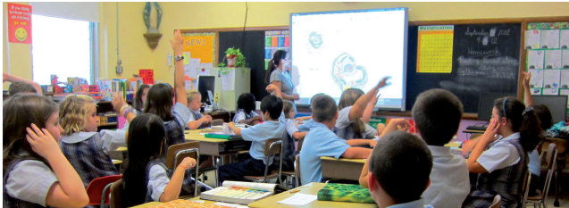
El clima del aula impacta en el aprendizaje.

En este sentido, como señalan Buitrón y Navarrete (2008), se hace indispensable formar docentes emocionalmente inteligentes , que puedan cumplir el reto de educar a sus alumnos con un liderazgo democrático, donde, a través de sus experiencias, puedan enseñar a reconocer, controlar y expresar respetuosa y claramente sus emociones. Por tanto, el clima del aula, generado por la actuación del docente, impactará definitivamente en el aprendizaje de los estudiantes.