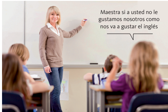
Véase un ejemplo de cómo puede influir en el aula el profesor emotivo.

Cuando el docente educa atendiendo la sensibilidad del alumnado, hace que este se sienta más cómodo en el aula, influyendo en su rendimiento académico. Además, no hay que olvidar que el profesorado es un modelo para el alumnado, y las conductas emocionales que este desarrolla en el aula van a servir de ejemplo. Estas conductas también van a influir en el clima de aula.