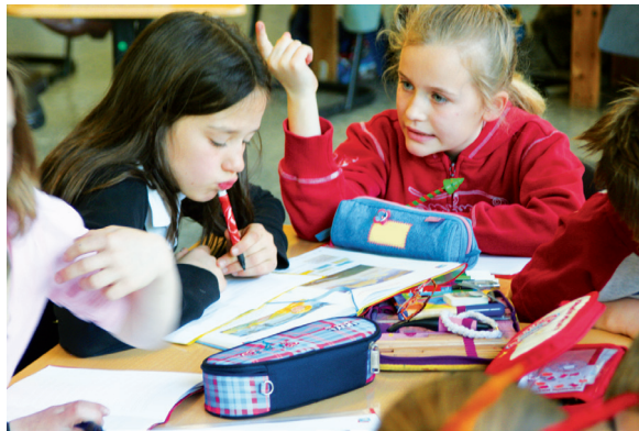
El aula es un escenario de aprendizaje de relaciones interpersonales.

Como señala Mir (1998), el conjunto de acciones e influencias que recibe cualquiera de los componentes humanos del aula (profesorado, alumnado, grupo, subgrupo) es bastante más complejo de lo que sería una combinación individual de las variables profesorado-alumnado. Además, en el entorno enseñanza-aprendizaje que se produce en el aula también hay que considerar que no se trata de un entorno estable: los efectos, presiones o influencias varían según el momento evolutivo, estado de ánimo, interacción... Por tanto, el aula, además de ser un espacio en el que se facilita el proceso de enseñanza-aprendizaje, es un contexto interactivo, donde se generan múltiples situaciones de comunicación. Se trata de un espacio significativo en la toma de conciencia del individuo como ser social, y un espacio para el aprendizaje de las relaciones (entre adulto y alumno/a y entre iguales).