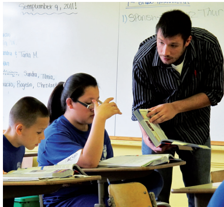
La mediación ayuda a la construcción de significados.

Existen distintos puntos de vista sobre el modo de actuar del profesorado en el aula. Se le ha considerado como el encargado de repartir o suministrar conocimientos, aunque actualmente se le ve, sobre todo, como un mediador en la construcción de significados a través del diálogo.