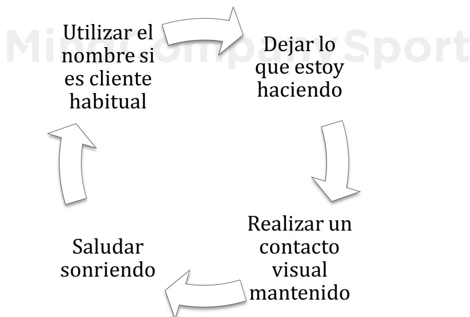
Ilustración 1. Conductas claves para la recepción de clientes.

Las conductas a las que nos referimos son más determinantes de lo que pueden parecer en un principio. De hecho, hacerlas o no, pueden marcar una diferencia de hasta un 20% por ciento en la facturación bruta del negocio. Un porcentaje nada despreciable para los tiempos que corren.