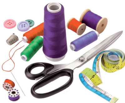
Véase este ejemplo de materiales que necesita el profesor para organizar una tarea.

Como resumen y conclusión final, se pueden considerar los procesos de cooperación en el aula como un interesante recurso complementario de la gestión instruccional en el aula, por supuesto, si se utiliza correctamente. Es decir, no debe interpretarse como una vía natural u espontáneamente organizada de acción docente que ahorre trabajo al profesor. Es un potente recurso cuya efectividad dependerá de que se haya planificado correctamente y se supervise de forma sistemática. Esto implica, esencialmente, tres aspectos: