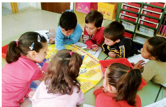
Si el trabajo se hace entre varias personas es más fácil.

Además, en situación de trabajo cooperativo en grupo comparten parte del éxito del grupo y, si bien no sustituye al éxito personal, adquieren clara representación de haber colaborado en el éxito grupal.