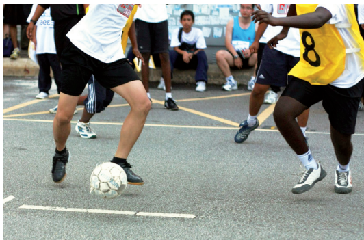
Ejemplo de trabajo cooperativo

Otra de las características del aprendizaje cooperativo es el tipo de interacción. Esta interacción que se produce en el aula puede ser como describe Poveda (2007):