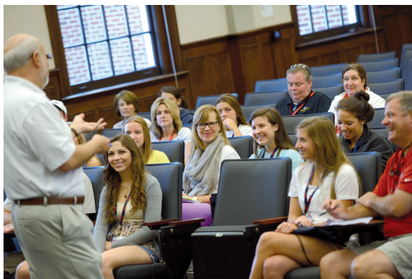
El grupo de trabajo está recibiendo unas indicaciones.