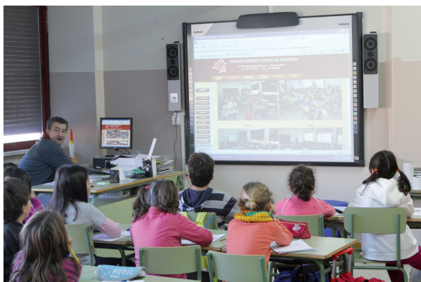
El profesor/a explica la tarea en el aula al grupo.