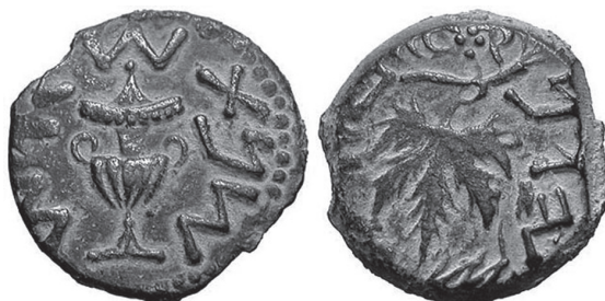
Para evitar la falsificación, las primeras monedas fueron acuñadas por las 2 caras.

El primer antecedente de falsificación de moneda se encuentra en Francia, en 1529. El rey de Francia, Francisco I, pagó 12 millones de escudos como rescate de uno de sus hijos retenido en España, los secuestradores comprobaron durante cuatro meses la autenticidad de todas y cada una de las monedas, el resultado fue el rechazo de 40.000 monedas por no cumplir los requisitos exigidos.