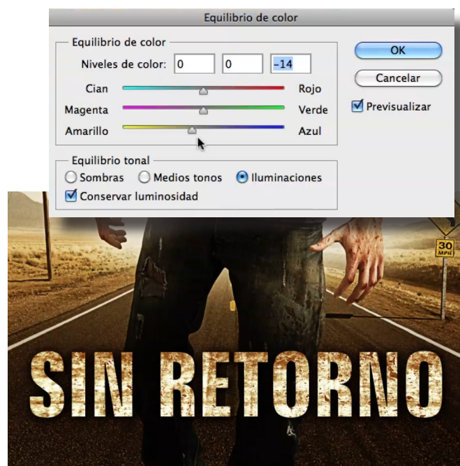
Fig. 57. Equilibrio de color

En el último video, vamos a añadir al cartel un subtítulo que hayamos inventado.