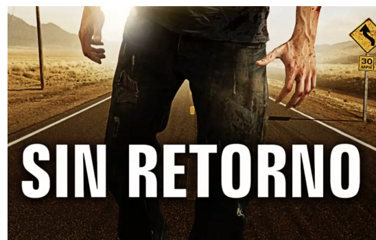
Fig. 56. Título

Finalmente, aplica una distancia de 7 píxeles, una extensión del 15% y un tamaño de 92. Si quedas convencido, pulsa "Ok". Aparecerá una indicación debajo de la capa de "efectos sombra paralela". Para añadir más relieve a las letras podemos darle textura, como veremos a continuación.