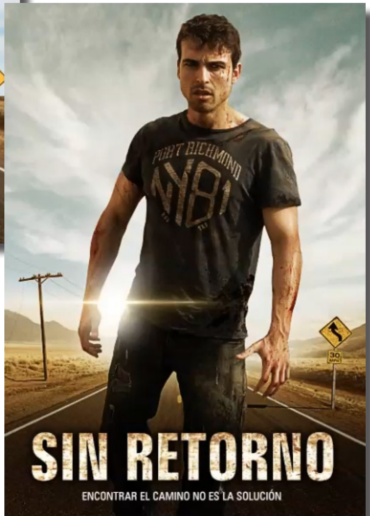
Fig. 60. Resultado final