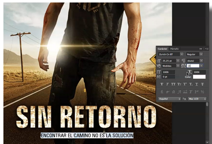
Fig. 58. Editar texto

Ahora pasamos a editar el texto. Para ello, colócate sobre la capa del subtítulo, coge la herramienta "Texto" y selecciona las letras del subtítulo en la imagen. Después, abre el cuadro de diálogo de "carácter" y elige el tipo que prefieras. En esta ocasión, trabajarás mejor con el color blanco. Aumenta el espacio entre letras para mejorar su legibilidad. Puedes probar diferentes espacios para que resulte fácil y cómoda su lectura, por ejemplo 16.